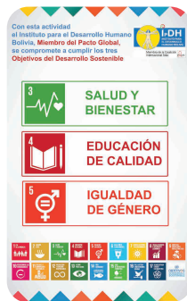
Objectifs de Développement Durable IpDH