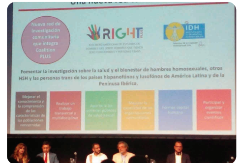
Lancement du réseau Right+ à Mexico

Nous continuons à travailler avec les Objectifs de Développement Durable du Pacte Global, en lien avec nos activités. La qualité de notre travail a été reconnue avec le Prix Laki , nous invitant à des réunions nationales (Santa Cruz) et internationales (Malaisie).