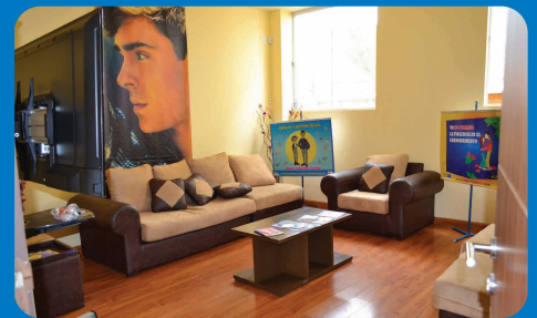
Espaces du nouveau centre de santé

Mis à part les divers espaces de soins (3 cabinets de consultations, 1 salle d’attente, 1 salle pour recevoir les adolescents, 1 laboratoire, 1 infirmerie et 1 pharmacie), le sous-sol a été transformé en une salle multifonctionnelle qui pourra servir aussi bien comme un espace d’expositions que comme un café ou lieu de rencontre.