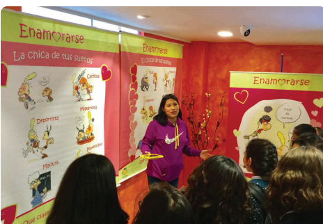
Visite de l'exposition Amor, Sexo y Algo más

Dirigée aux élèves de primaires et secondaire des collèges, a été visitée par 1500 personnes.