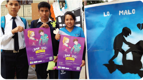
Elèves faisant la promotion de la page Web

Ce nouveau projet, financé par la Fédération Genevoise de Coopération , la Fondation Hirzel et l' IPDH Suisse , a représenté un grand défi pour notre équipe.