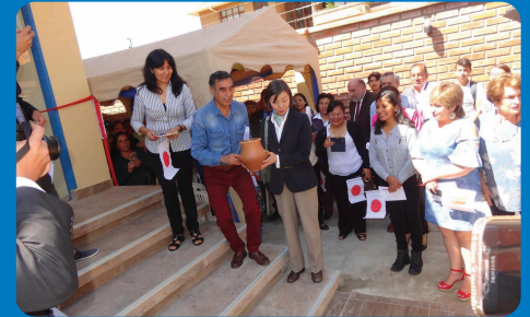
Inauguration du Centre avec l’Ambassadrice du Japon,

Après plusieurs années d’attentes, dues aux démarches administratives, nous avons eu le plaisir d’inaugurer le Centre Communautaire de Santé Sexuelle et Affective au début de l’année, grâce aux fonds de l’ Ambassade du Japon, IDH Suisse, Fondation Stars, Coalition + et aux fonds propres de l’IpDH .