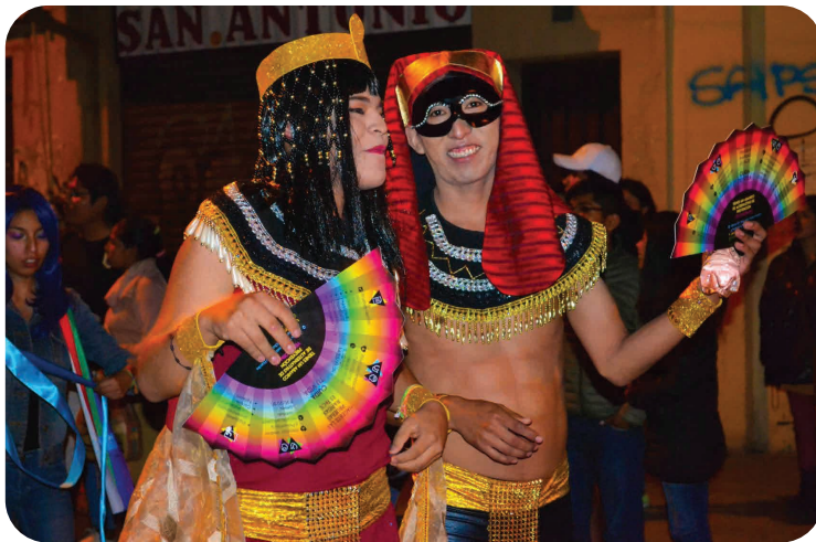
Marche des Diversités sexuelles